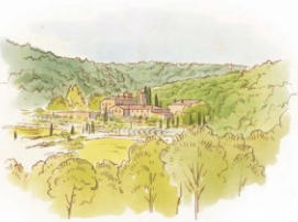
Point de vue