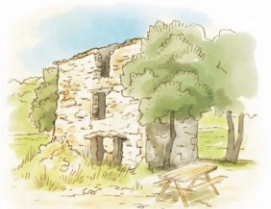
Table de pique-nique