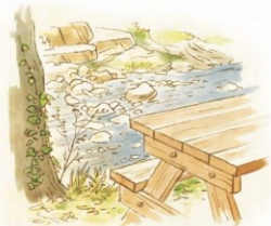
Table de pique-nique en bord de rivière