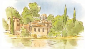
Monastère orthodoxe Saint-Michel